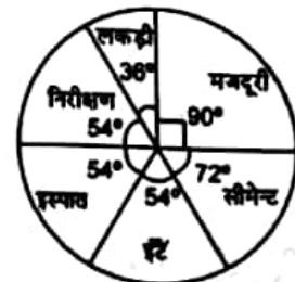
मकान बनाने में लगे धन का ब्यौरा

निर्देश (प्र.सं. 15 और 16) यहाँ दिया गया पाई ग्राफ एक मकान के बनाने में किए गए व्यय के ब्यौरे को दर्शाता है। यह मानते हुए कि निर्माण पर कुल व्यय ₹ 600000 हुआ, तो उत्तर दीजिए